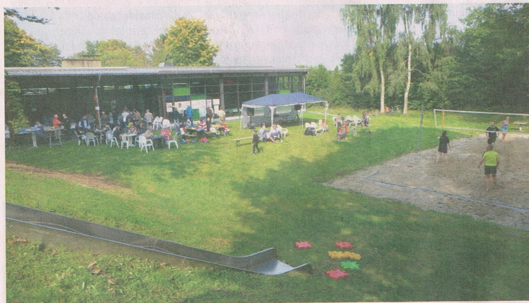
Sommerfest am Hallenbad

Der Verein „Schwimmfreunde Rheurdt e.V.“ betreibt das Hallenbad mit Unterstützung der Gemeinde seit 2012. Vor fünf Jahren wurde der Verein auch Eigentümer des Gebäudes und hat seitdem grundlegende Sanierungs- und Umbaumaßnahmen zum langfristigen Werterhalt des Hallenbades durchführen können. Ein schöner Erfolg ist die stabile Zahl von inzwischen über 1.700 Mitgliedern sowie das andauernde hohe ehrenamtliche Engagement. Für 2022 ist eine umfangreiche Dachsanierung sowie ein Sommerfest geplant. Zum Auftakt des Jubiläumsjahrs können bereits am 16. Januar 2022 auch Nicht-Mitglieder das Vereinsbad kostenfrei kennenlernen.