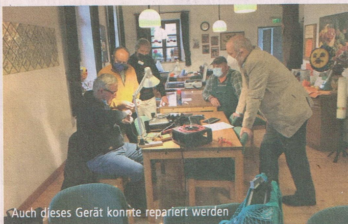
Auch dieses Gerät konnte repariert werden

z.B. bei Software-/Hardwareproblemen an. Da auch Kleinigkeiten an Reparaturmaterial Kosten verursachen, bittet das ReparaturCafé um Spenden von den BesucherInnen. Wer noch mithelfen möchte oder noch Fragen hat, kann sich unter fhoffmann@2zack.de oder 69045 in Rheurdt melden.