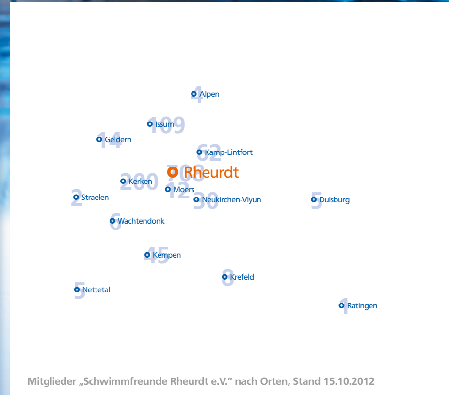
Mitglieder „Schwimmfreunde Rheurdt e.V.“ nach Orten, Stand 15.10.2012